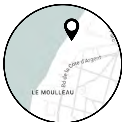
Villa CASA SYLVA Arcachon - Le Moulleau